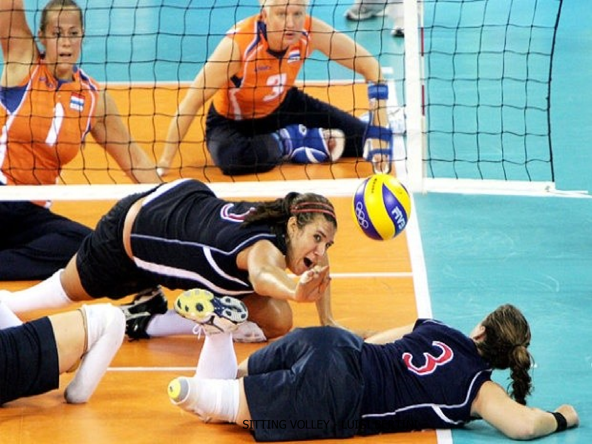
SITTING VOLLEY - FLUID